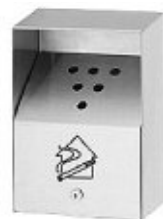
Exemple de cendrier mural extérieur